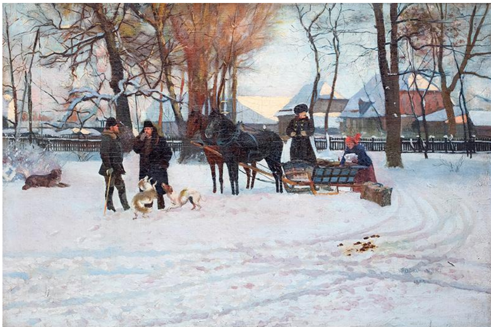
Władysław Podkowiński Wyjazd na polowanie

Dziecko ogląda obrazy. Rodzic prosi, aby powiedziało, czym się one różnią, a w czym są podobne